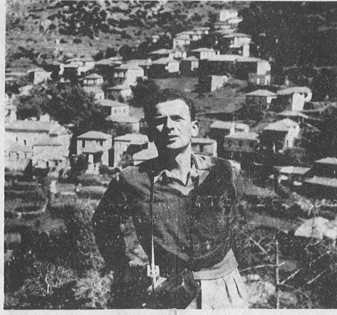
Πώς τίς θυμάμαι του χωριού τίς όμορφες κοπέλες τίς Ρήγες, τίς Βαγγελιές, τίς Κούλες, τίς Μαρίες που δέναν πίσω στα μαλλιά χρωματιστές κορδάλιες και γέλαχν με τίς παλιές του τόπου ιστορίες. (Τό τελευταίο του ποίημα)

από 70 χρόνια...» Η ειδηση είναι φανερά αντιδημοσιογραφική. Τί θά πει τώρα τό πληροφορηθήκαμε; Και τί θά πει πριν από 5 περίπου μήνες; Άλλά εδώ είναι όλη ή ουσία τής εφημερίδας «Τά Τσίντζινα». Δέν πειράζει που τό πληροφορηθήκαμε τώρα, έμεις, εγώ ο Μοτίβος, έσεις, όλοι μας, μετά καθυστέρηση 5 περίπου μηνών, μάς πειράζει τό γεγονός ότι αυτός ο άνθρωπος πέθανε πριν προλάβει να γυρίσει στον τόπο του, πριν προλάβουμε να τον υποδεχτούμε στο χωριό μας, στο χωριό του, να τον καλωσορίσουμε και να τον κεράσουμε λουκούμι με παγωμένο νερό από τό Χάρακα. Ο θάνατος του ξεχασμένου μετανάστη πατριώτη μας έχει για μάς μεγαλύτερη σημασία από τον θάνατο του Ωνάση, που δέν ήταν μάρμας μας, αλλά μάς τον έκαναν μάρμα μας οι μεγάλες εφημερίδες. Έτσι λοιπόν ο Μοτίβος τίς ειδήσεις του δέν τίς έπαιρνε από τό Ράβυτερ ή τό Άθηνάκι Πρακτορείο Ειδήσεων, αλλά από τον ίδιο τό λαό, με γράμματα, με τηλεφωνήματα, με προσωπικές έπαφές, μέσω τρίτων, μέσω τέταρτων, μέσω πέμπτων, ή ειδηση έκανε τή χρονική της σημασία, απογυμνωόταν από τά έξωτερικά περιστατικά και γινόταν συναισθημα. Κι' έτσι ή εφημερίδα «Τά Τσίντζινα» ήταν μία εφημερίδα, από τίς λίγες που γράφονται από τους αγνηώστες τους.